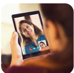
edukačné videá na rôzne témy