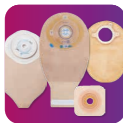
odborné poradenstvo o produktoch a bezplatné vzorky