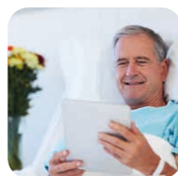
využitie tabletov v nemocniciach na edukáciu