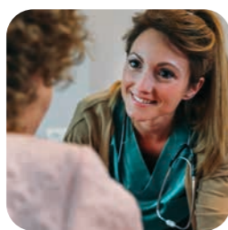
poradenstvo zdravotníckych pracovníkov

Keď potrebujete radu, podporu a istotu, sme tu pre vás. Môžete sa zúčastniť prezenčných prednášok a stretnutí alebo zavolať našim špecialistkám v zákazníckom centre, ktoré sú ochotné vždy poradiť.