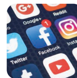
skvelé spojenie pomocou sociálnych sietí