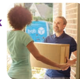
spoľahlivé doručenie pomôcok až k vám domov

Naša diskretná doručovacia služba vám prinesie všetky stomické pomôcky, ktoré potrebujete, priamo k vašim dverám. Vieme, aké sú pre vás dôležité, a preto naše bezplatné, rýchle a spoľahlivé doručenie znamená, že sa nebudete musieť obávať, že ich nebudete mať k dispozícii.