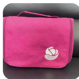
zadarmo taštička s propagačnými materiálmi a drobnosťami na starostlivosť o stómiu

Domov z nemocnice odídete so stomickými pomôckami na 1 mesiac. Nebudete tak musieť hneď prvé dni po prepustení riešiť ich dostupnosť. Počas celého vášho života so stómiou tu budú pre vás špecialistky v zákazníckom centre. Môžete s nimi hovoriť o produktoch, starostlivosti o stómiu, aktivitách bežného života. Ak nebudú vedieť zodpovedať vaše otázky, tak vás nasmerujú na odborníkov vo vašom regióne. V prípade záujmu vám pošlú bezplatne vzorky našich produktov na vyskúšanie. Budete tiež dostávať bezplatný časopis Radim, ktorý je plný užitočných tipov a rád na život so stómiou.