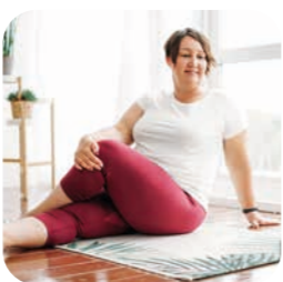
program me+ recovery súbor cvikov pre rýchlejšiu rekonvalescenciu