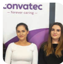
bezplatná linka zákazníckeho centra