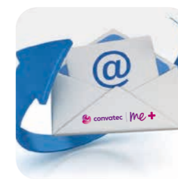
pravidelné zasielanie emailov

Naše pravidelne zasielané emaily vám dajú veľa tipov a rád týkajúcich sa životného štýlu, budete vedieť o novinkách v starostlivosti o stómiu a o produktoch. Môžete nás sledovať aj na sociálnych sieťach, kde sa veľa dozviete.